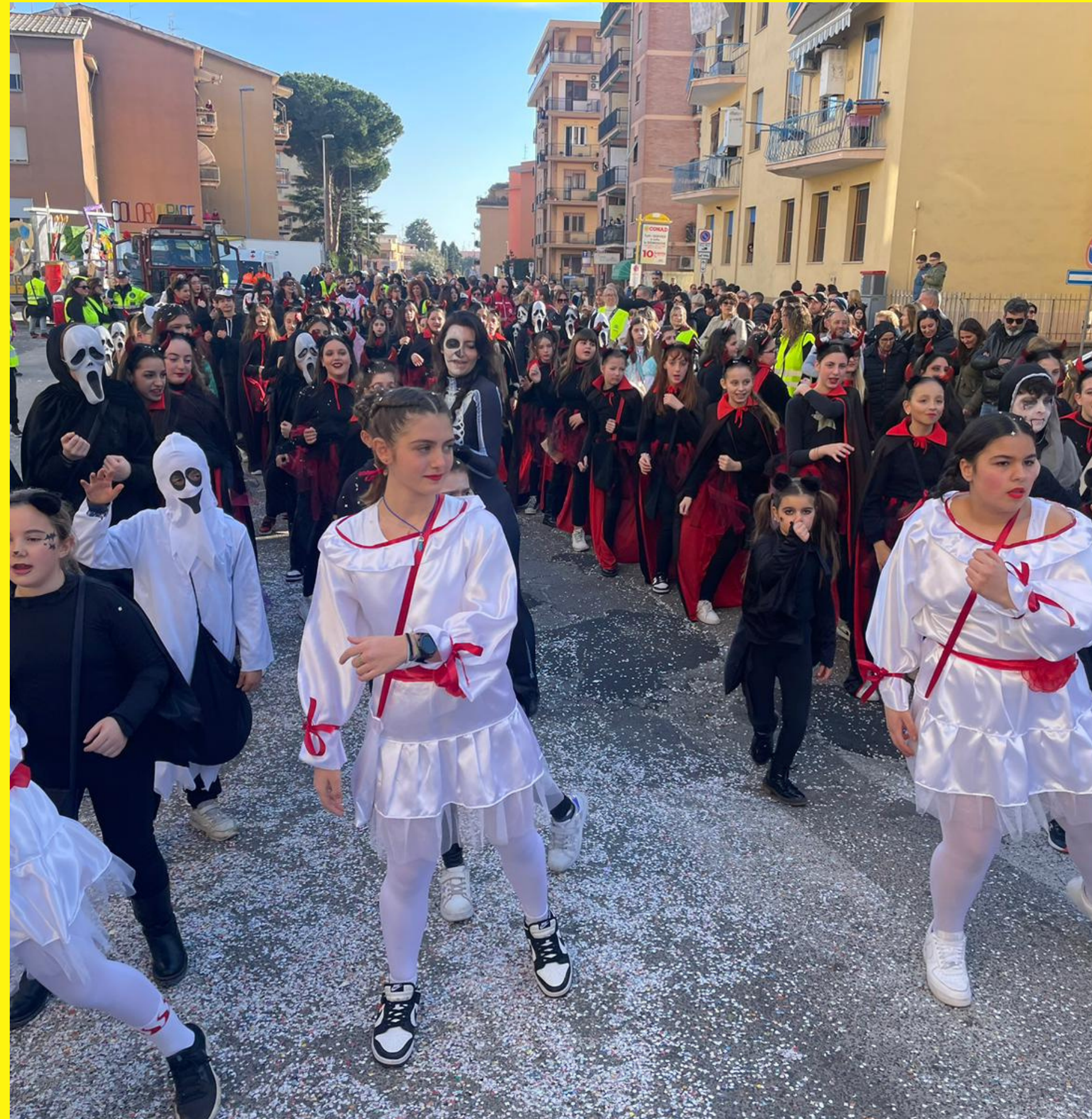
Alcuni momenti della sfilata