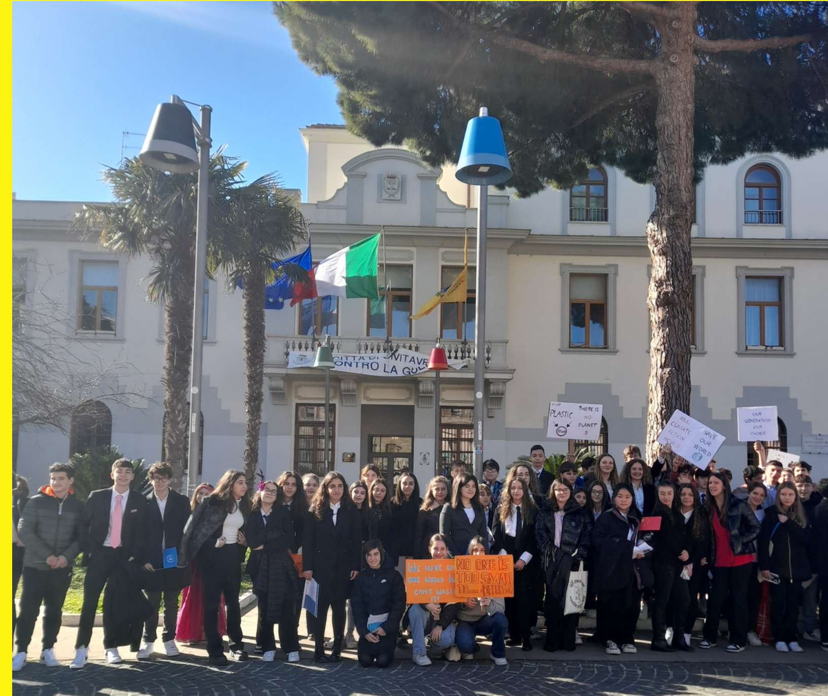
I nostri ragazzi davanti al palazzo del Pincio