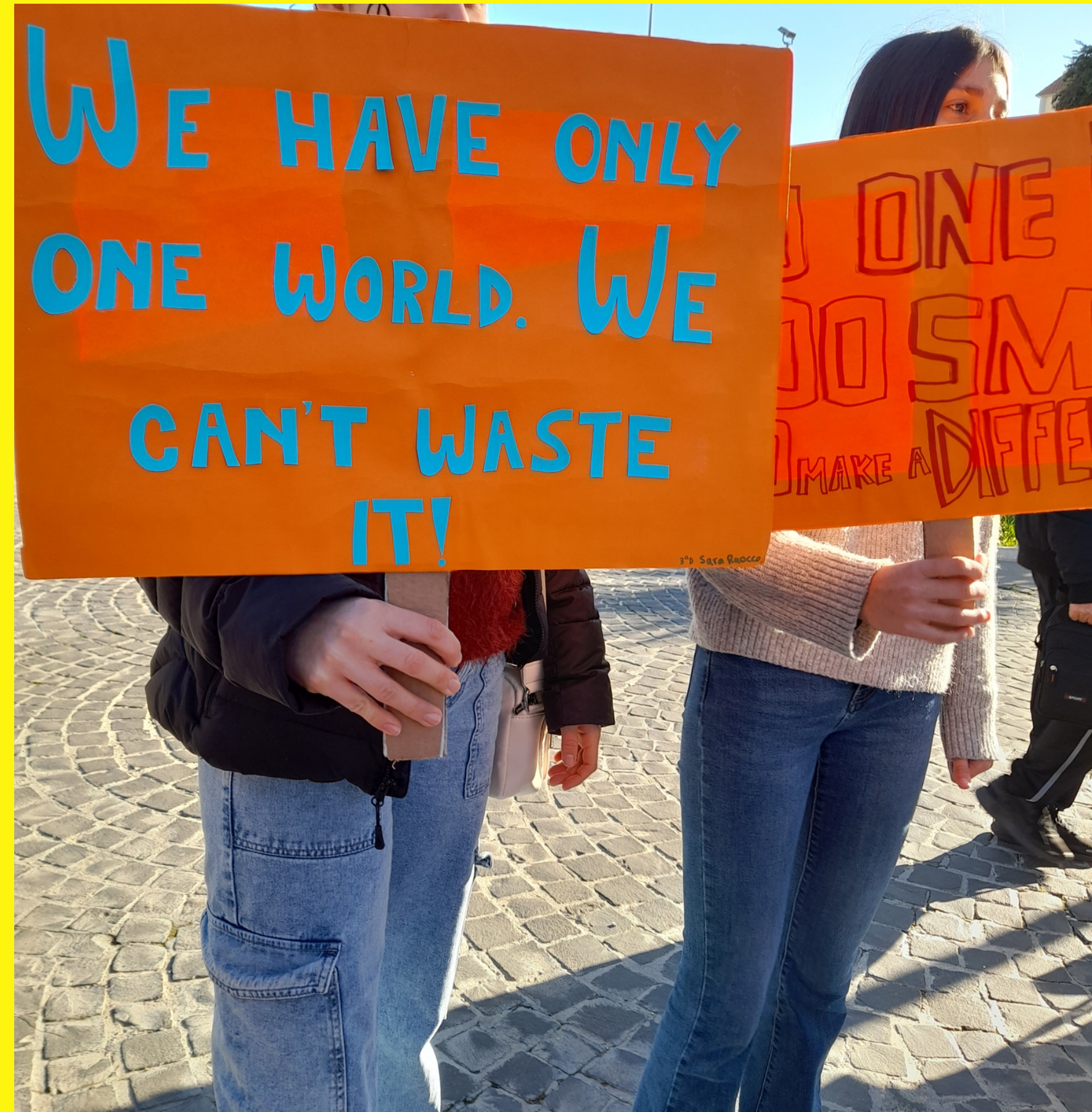
Alcuni momenti della conferenza all'aula Pucci e del corteo, in difesa del pianeta contro i cambiamenti climatici