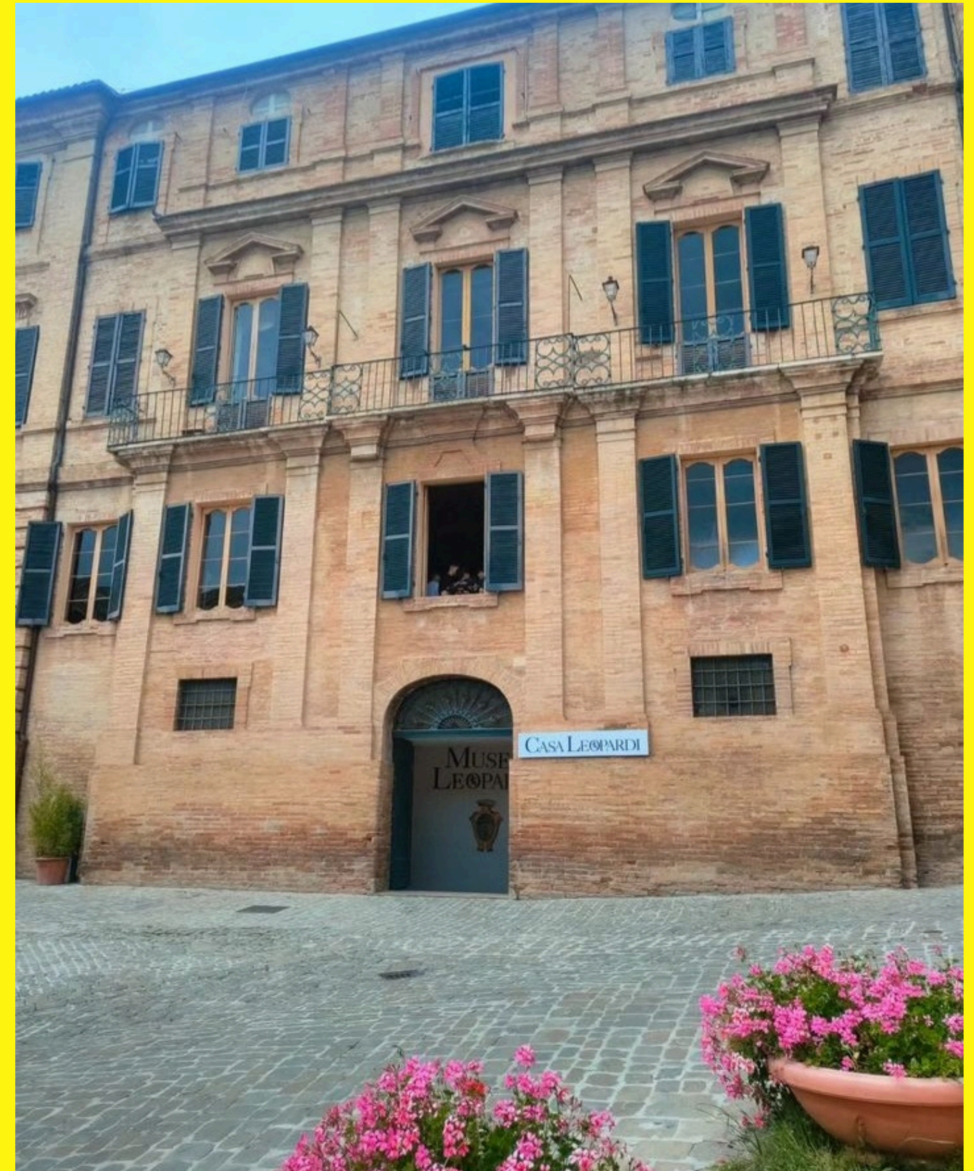
Recanati. La casa di Giacomo Leopardi

Tre giorni davvero particolari quelli vissuti dagli alunni delle nostre classi terze della scuola secondaria, hanno svolto il viaggio d'istruzione nelle Marche alla scoperta dei luoghi leopardiani e delle bellezze naturalistiche del territorio. Prima tappa Recanati per visitare il borgo dove Leopardi trascorse l'infanzia e scrisse capolavori come "A Silvia". Seconda tappa il promontorio del Conero con le sue meraviglie paesaggistiche e a seguire visita alla città di Ancona. Prima del rientro, non poteva mancare un'escursione alle grotte di Frasassi, in un'affascinante passeggiata tra stalattiti e stalagmiti di origine antichissima.