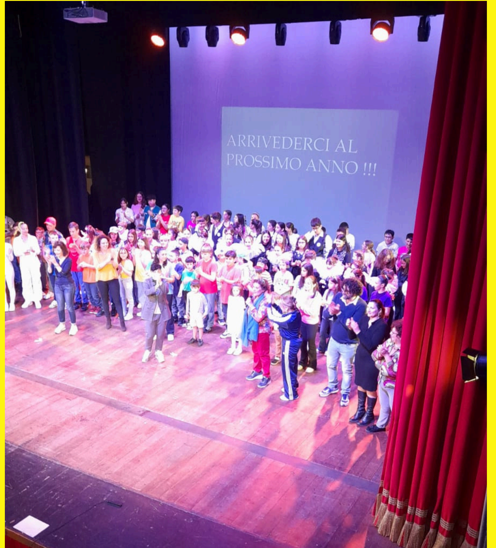
I nostri alunni sul palco del teatro Traiano