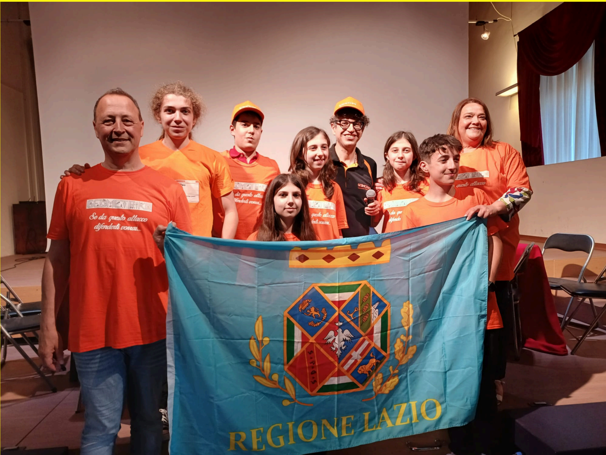
I nostri alunni vincono il terzo posto