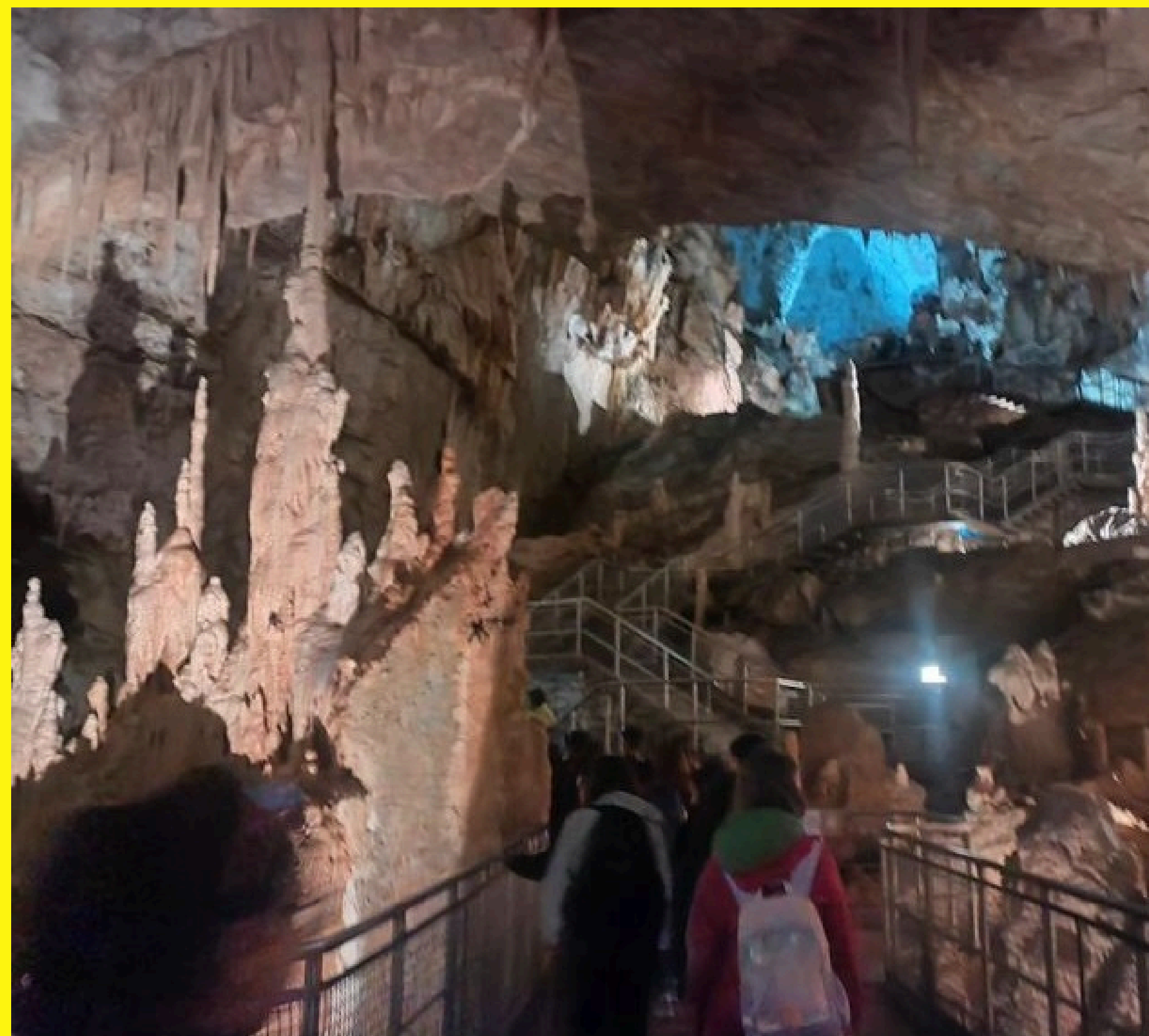
I nostri alunni in visita ad Ancona e alle Grotte di Fra