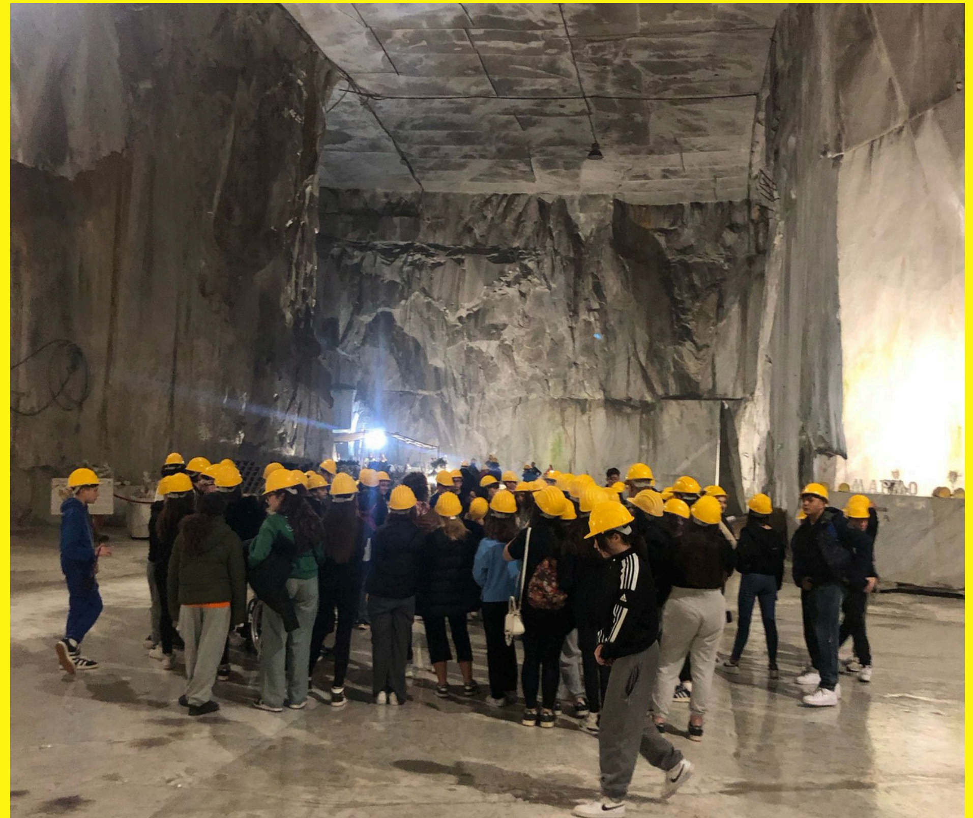
I NOSTRI RAGAZZI NELLE CAVE DI MARMO