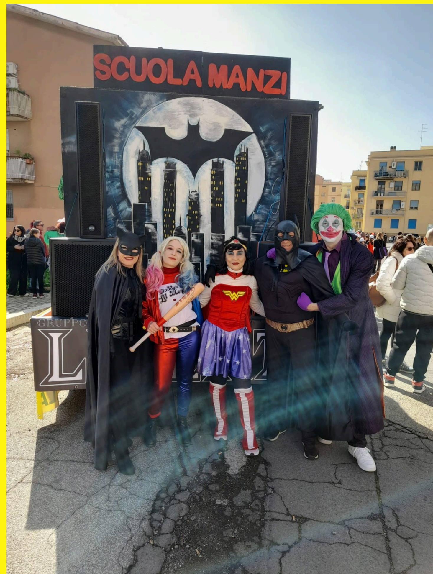
I NOSTRI SUPER PROF. MASCHERATI